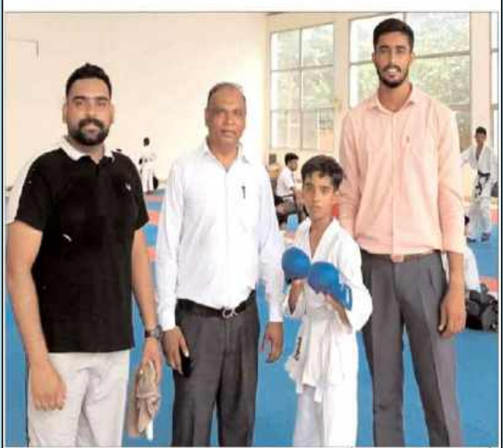
चंडीगढ(एचकोए उपरो)। हमें यह घोषणा करते हुए खेतद खुश्ची हो रही है कि में एक अक्षेत्र-नैय उपलब्धि हासिल भी है। डीएवीं स्कूल के कथा सात के कराटे के लिए अंडर-14 वर्ग में प्रतिस्पर्धा