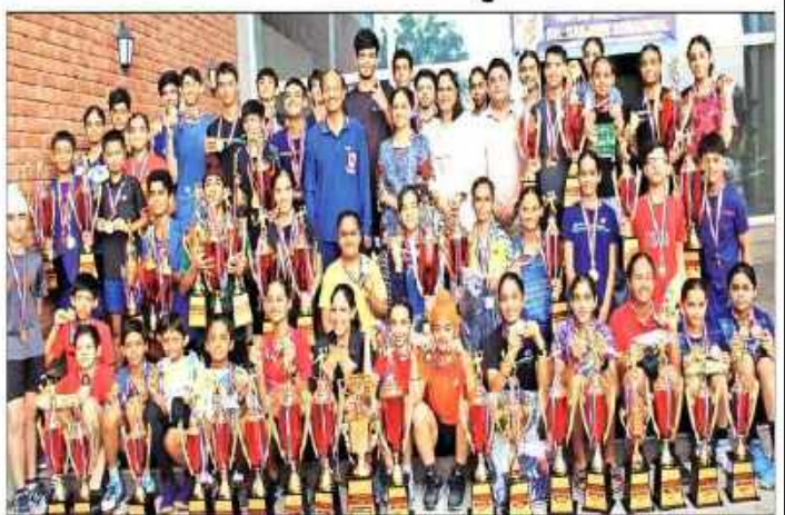
पूर्व क्यों के विशेष खिलाड़ों टॉकी और एमोगियान के प्रक्रिय प्रीट प्रशासन के पाप ।