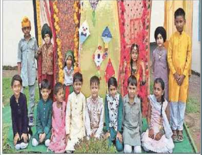
रीवटा-39 स्थित डी.ए.वी. स्कूल के बच्चे तीज पर्व में हिस्सा लेते हुए।

सैक्टर-३७ स्थित डी.ए.वी. स्कल पहन कर आए। में हरियाली तीज उत्सव धूमधाम संस्कृति के प्रति जागरूकता लाना चहकर हिस्सा लिया।